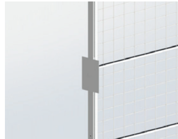
Platzierung A5 hoch