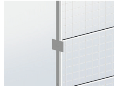
Platzierung A6 quer