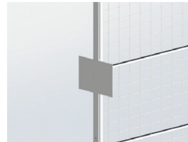
Platzierung A4 quer

Technische Änderungen jederzeit vorbehalten.