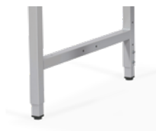
Vis de serrage

• 880-1180 mm • réglable par vis de serrage, manivelle ou moteur électrique